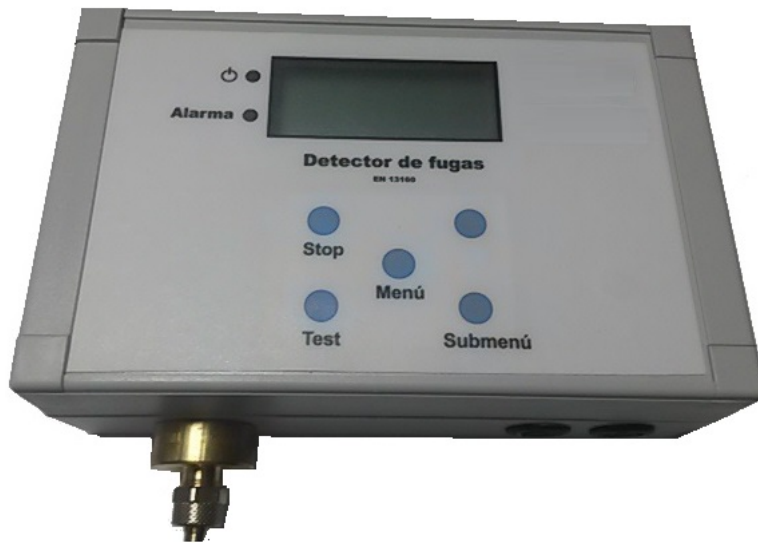
Panel de control